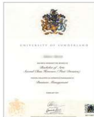
国外学士学位证书