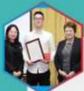
(2017级学生, 2018年度SQA理想大使)