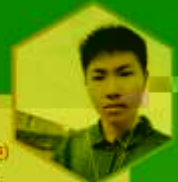
(2018级学生, 2019年度理想形象大使)

能够当选理想大使,是给我的荣耀也是给我的一次激励与鞭策,我会更加严格要求自己,在完成自己学业的同时,更多地帮助老师与同学,以此回报学校对我的培养,让我们一起努力学习,共创美好未来!