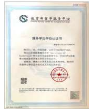
本科学位认证证书